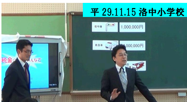
平 29.11.15 洛中小学校