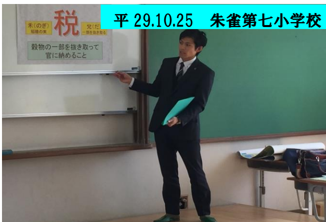
平 29.10.25 朱雀第七小学校