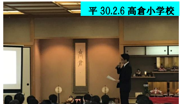
平 30.2.6 高倉小学校